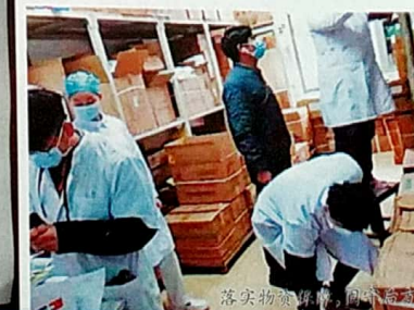
落实物资保障,保障物资供应