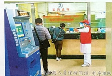
引导购药人员保持间距,有序排队