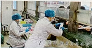
坚守病房,谢绝家属探访