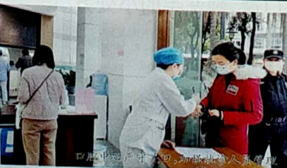
口腔中心严守关口,加强就诊人员管理