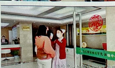
体检中心加强出入人员管理