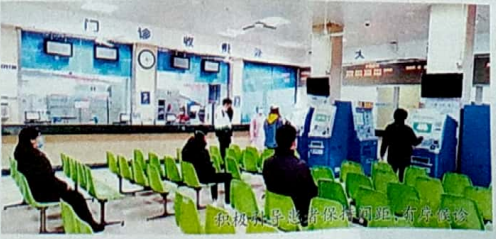
预检分诊患者保持间距,有序就诊