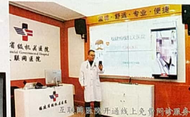
互联网医院开通线上免费咨询服务