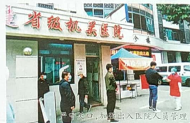
严守关口,加强出入医院人员管理