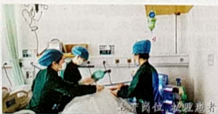
严格探视,谢绝陪护